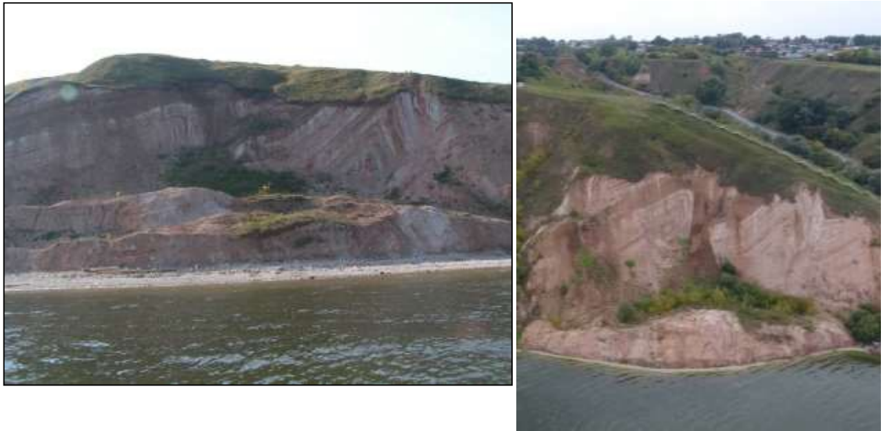
Рис. 1. Наблюдательный участок в 2006 г. (слева) и 2009 г. (справа)

С 2019 г. для съемки участка используется беспилотный летательный аппарат (БПЛА) DJI Phantom 4. Съемка осуществлялась с использованием наземных опорных точек, полученных с помощью ГНСС-приемника Emlid Reach RS+, работающего в режиме кинематики реального времени от базовой станции, расположенной на расстоянии не более 20 км.