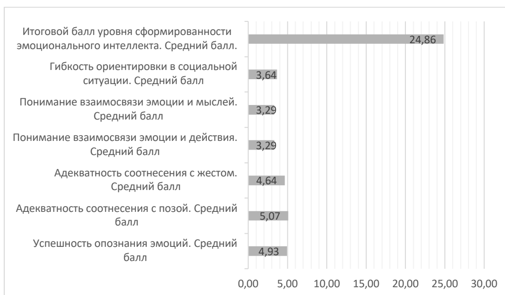
Рисунок 2 - Средние значения исследуемых показателей эмоционального интеллекта

Исследование показало, что наиболее сформированными составляющими эмоционального интеллекта обследованных дошкольников являются Адекватность соотнесения с позой (средний балл = 5,07) и Успешность опознания эмоций (средний балл = 4,93), а наименее сформированными - Понимание взаимосвязи эмоций и мыслей (средний балл = 3,29) и Понимание взаимосвязи эмоций и действия (средний балл = 3,29). Средний итоговый балл данной выборки составил 24,86.