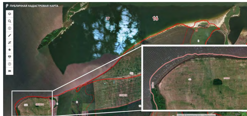
Рис. 3. Исследуемый участок на публичной кадастровой карте

Работа выполнена при финансовой поддержке РФФИ, проект № 18-09-40114 Древности. «Страна городов» – комплексное изучение городищ Волжской Булгарии современными методами.