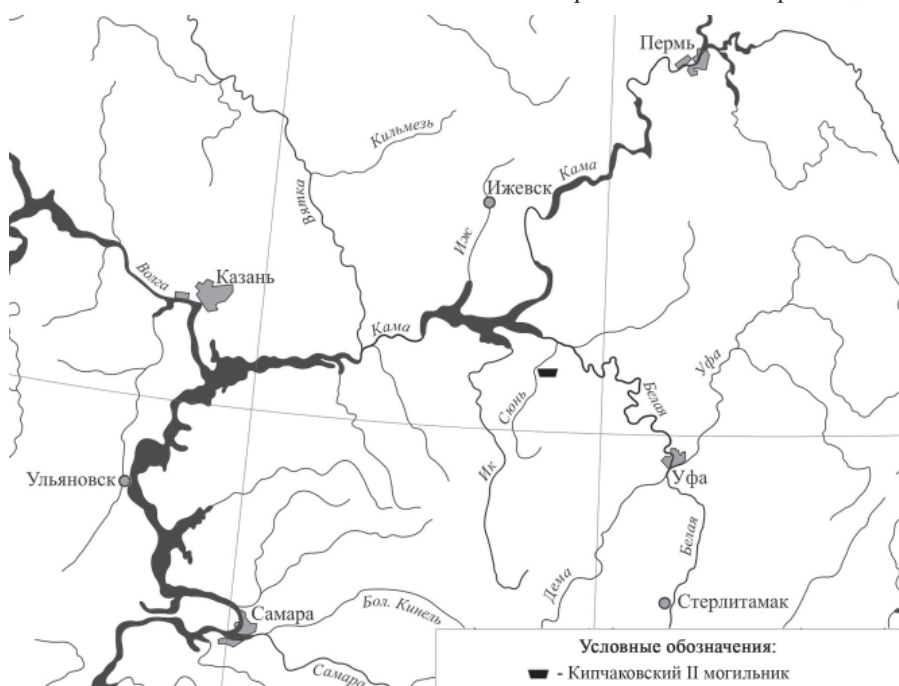
Рис. 1. Кипчаковский II могильник. Карта-схема расположения.

Статья поступила в журнал 01.09.2020 г Авторы статьи внесли равноценный вклад в работу