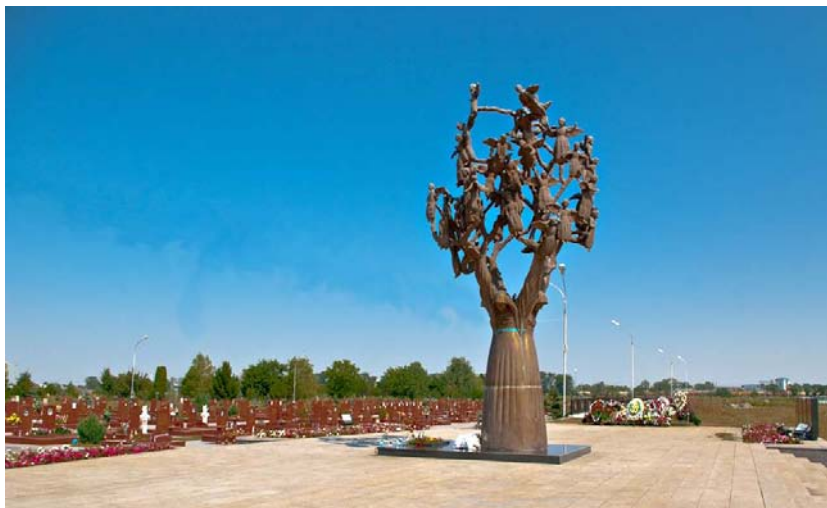
Город ангелов. Древо скорби. Беслан. Северная Осетия – Алания [27]

каждой из которых выгравированы имена более 3000 жертв теракта 11 сентября 2001 года, а также имена тех, кто погиб во время атак на Всемирный торговый центр в 1993 году. К основанию ведут девять дорожек» [12]. Не менее символична и длина слезы – 11 метров. Символика цифр связана с да-той трагедии.