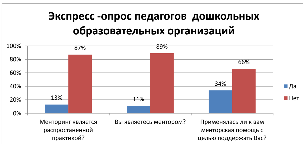
Рис.2. Распространенность менторинга на территории Российской Федерации

В результате нашего исследования было выявлено, что в процессе становления научных основ менторинга большое значение имеют технологии менторинга, применяемые в условиях дошкольной образовательной организации. На Западе менторинг воспринимается как почетная миссия, в России менторинг только лишь обретает популярность. Соблюдение классификации менторинга позволит менторам определить стиль индивидуального управления, а цикличность позволит делегировать и организовывать деятельность детского сада с максимальной отдачей. В связи с этим успех менторинга будет зависеть от соблюдения вышеизложенных аспектов и позволит обеспечить эффективное управление дошкольной образовательной организацией.