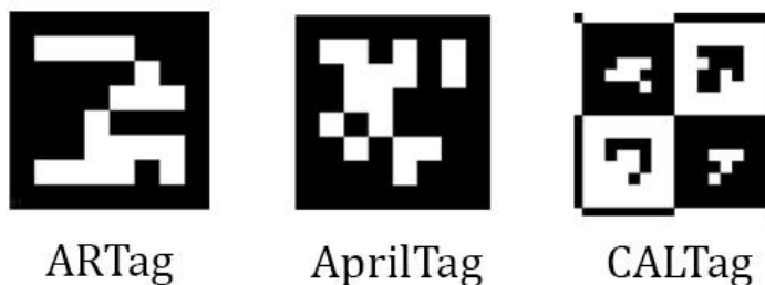
Рисунок 1. Метки слева направо: ARTag, AprilTag, CALTag

Для оценки производительности метки обычно используются следующие критерии: устойчивость к перекрытиям (окклюзии), устойчивость к изменению освещения, вероятность путаницы между идентификаторами (ID) меток, минимально определяемый размер метки, максимальное расстояние до метки и другие [5]. Эти критерии позволят определить подходящую метку для дальнейшего её применения в поставленной задаче калибровки камеры и манипулятора робота. Далее, для применения метки на роботе, планируется закрепить ее на манипуляторе в уменьшенном размере для автоматической калибровки без участия человека. Вследствие этого может возникнуть частичное перекрытие метки другими объектами (самим манипулятором робота, другими попадающими в кадр объектами), а также