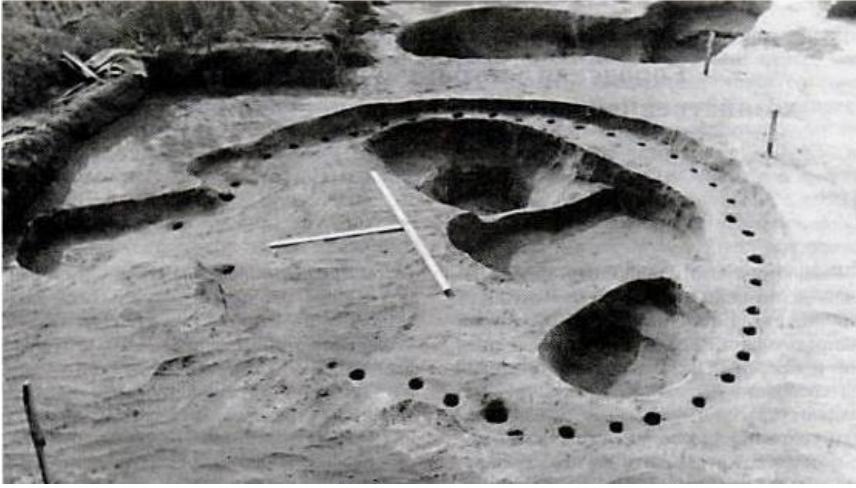
Resim 2: Çadır tarzı sabit yerleşim (F. Ş. Huzin'in kazısından) Bilyar yerleşimi.

Arkeolojik araştırmalar ile kanıtlandığı üzere, İdil bölgesine taşınmış olan İdil Bulgarlarının yerleşim izlerine VIII. yüzyılın ilk yarısına ait kalıntılarda da rastlanmaktadır (Matveyeva, 1997, 99). Samarskaya Luka'daki Ser-yukaevskovo II'nin alt tabakasında bulunan materyaller arasında Saltovo-Mayak tarzındaki alçı ve çömlek seramikler, amfora parçaları, değirmen taşları, demir, kemik gibi materyallerden ürünler oldukça kayda değerdir. Yerleşimde kazı yapanlar, Novinkovo tarzı anıtlar bırakmış olan Bulgarlar için "göçebe olarak değil, tarımla uğraşan yerleşik halklar olarak görülmelidirler" şeklinde haklı görüş belirtiyorlar (Yermakov - Matveyeva, 2002, 49). Samara'lı arkeolog Dimitri Staşenkov, Proletarskovo yerleşiminde yaptığı kazılar sonucu buna benzer bir görüş ortaya koymuştur. Bu yerleşimdeki buluntular, "Hazar dönemi göçebelerinin yerleşik hayata geçiş sürecinin başlangıcına işaret eden" ciddi sayıda amfora parçaları ve dairesel Saltovo-Mayak seramiği içermektedir (Staşenkov, 1999, 76). Ulyanovsk Oblastındaki bazı erken Bulgar yerleşimleri Yuri Semikin tarafından çalışılmış ve elde edilen bilgilerden bölge halkının demircilik ve eritme mesleğini icra ettiklerine dair açık deliller elde edilmiştir (Semikin, 2015, 43). Bazı yerleşimlerin kültürel katmanlarında, örneğin Bulgarskovo Gorodişe bölgesinde Nijni Kama civarındaki İzmerskovo yerleşiminde 814, 894/895, 902-908 yıllarına tarihlenen sikkeler bulunmuştur (Huzin, 2010, 121-122).