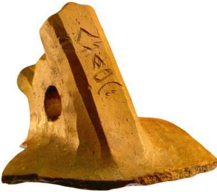
Resim 1: Zoomorfik tutmaçlı Runik yazı. Kil. Bilyar yerleşimi.

düğü Bulgarların anavatanlarını Urallar ve Altaylar arasındaki orman-bozkır bölgesi olarak belirledi (Raşev, 2004, 27).