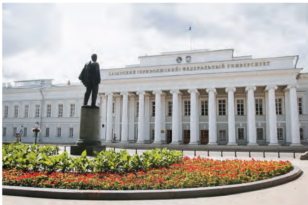
Казанский (Приволжский) федеральный университет

Отношение к процессам глобализации и распространения влияния сети Интернет всегда будет