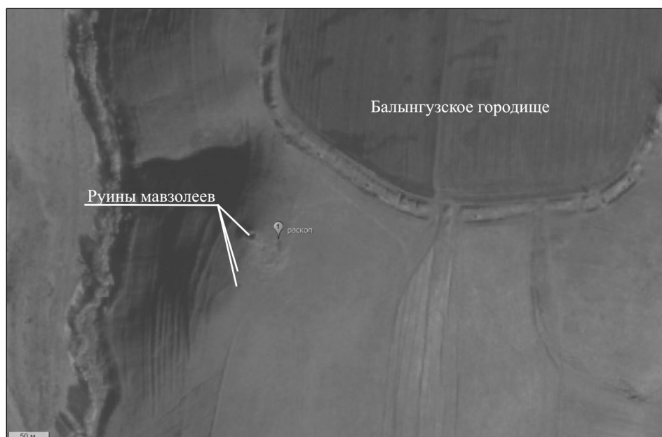
Рис. 1. Месторасположение раскопа на космическом снимке.