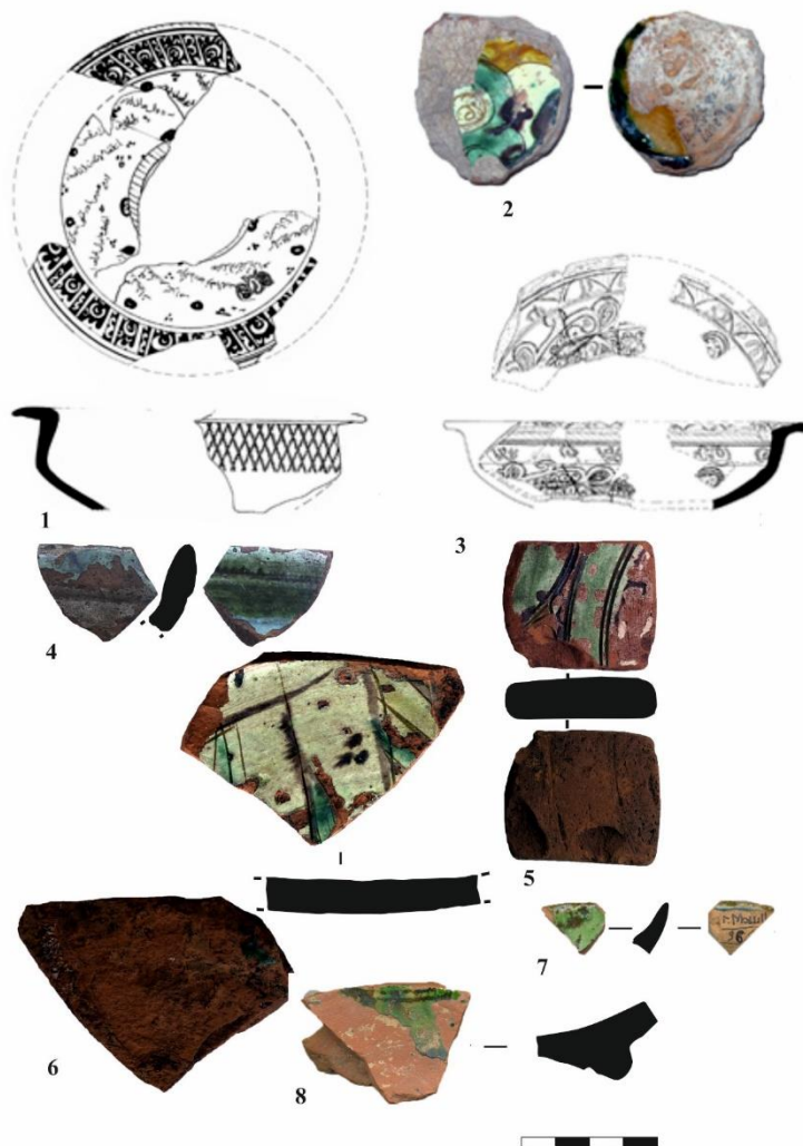
Рис. 1. Поливная керамика ширванского производства. Азак 1–3 (по С.А. Кравченко); Болгар 4–6; Мошаик 7, 8.

Fig. 1. Glazed Pottery of Shirvan production. Azak 1-3 (after S.A. Kravchenko); Bolgar 4-6; Moshajik 7, 8.