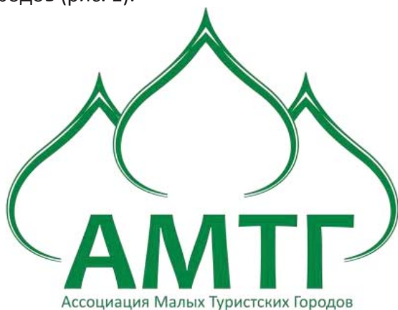
Рис. 1 – Логотип Ассоциации малых туристских городов

Подтверждением этого является создание в 2007 году Ассоциации малых туристских городов (рис. 1).