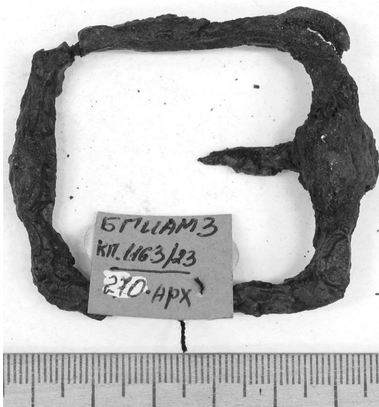
Рисунок 4 – Пряжка с сохраненным покрытием полимеризованного клея БФ до реставрации

Предметы вымачивались в растворе, затем помещались на 1 сутки в нагревательную печь при температурах 185, 200, 210 °С, или