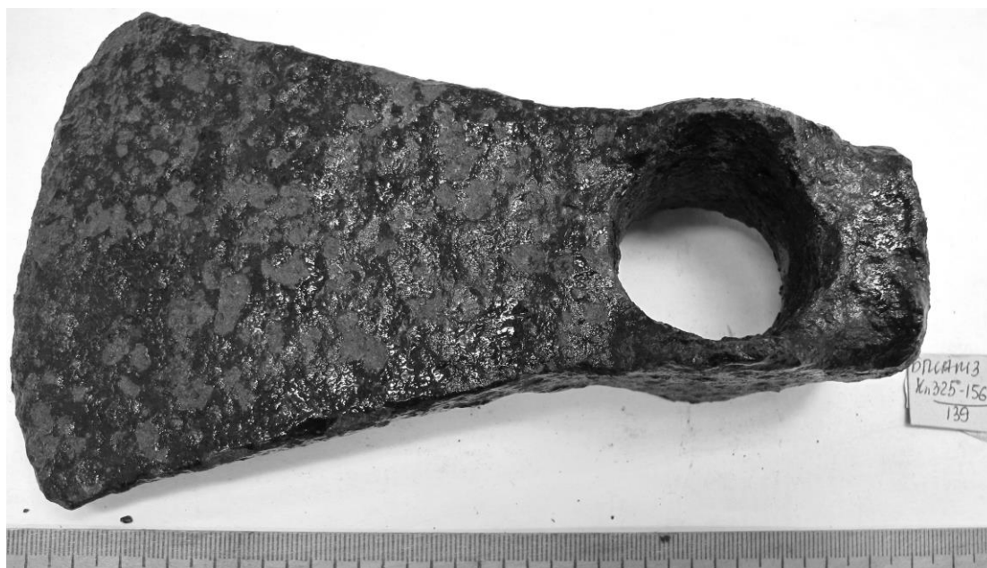
Рисунок 3 – Мотыга с частичным покрытием полимеризованного клея БФ до реставрации