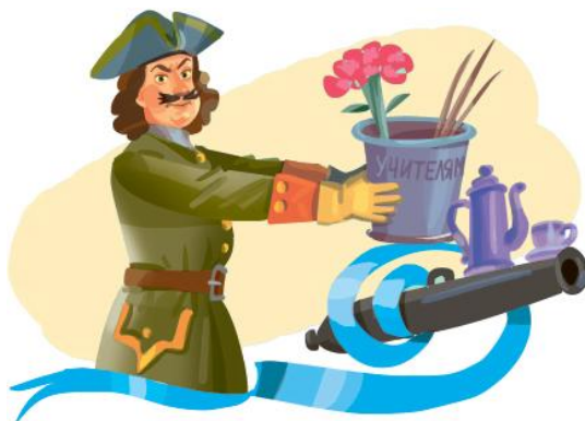
Рис. 3. Иллюстрация к рассказу