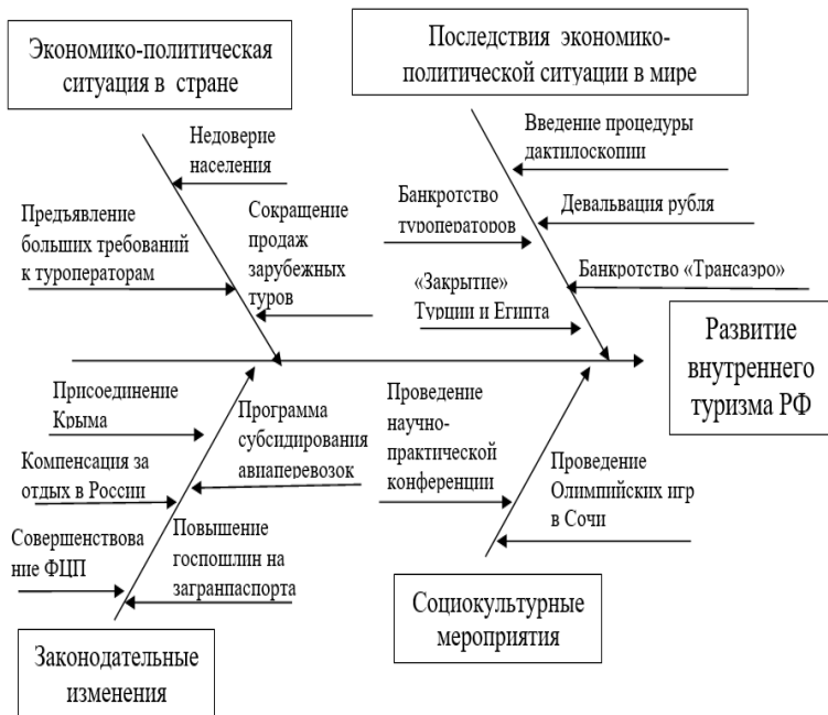
Рис.1. Диаграмма Исикавы. Факторы развития внутреннего туризма.

Итак, на основе детального факторного анализа развития внутреннего туризма России в 2014-2015 гг. мы сделали вывод, что существенным толчком подъема отрасли послужила негативная внешнеэкономическая и политическая ситуация в мире, отразившаяся наибольшими количественными и качественными факторными показателями в диаграмме Исикавы. Наиболее гибко и эффективно на эти изменения отреагировало Правительство РФ, создав благоприятные правовые условия для развития внутреннего туризма России.