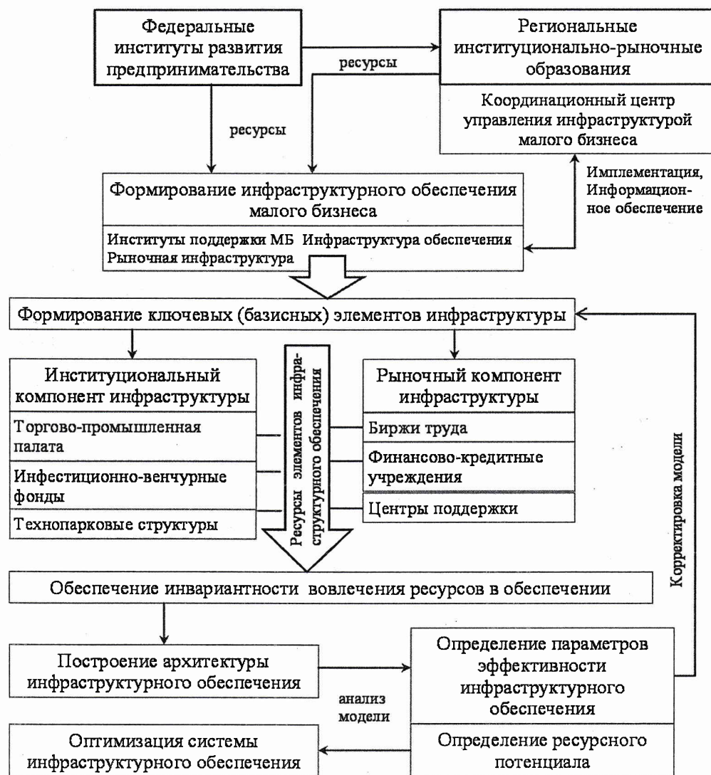
Рис. 2. Структурно-функциональная модель инфраструктурного обеспечения малого бизнеса РТ (в рамках институционально-рыночного подхода)

– учет существующего уровня обеспечения предпринимательства финансово-кредитными, техническими, информационными ресурсами и специфики институционально-рыночной инфраструктурой в целом в соответствии с раз-