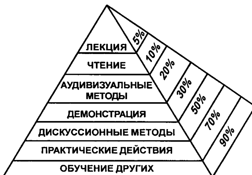
Рис. 1. «Пирамида познания» по Д. Мартину

Важным требованием для школы (прежде всего высшей) является необходимость использования в учебном процессе игровых форм, дискуссий, семинаров, групповых и индивидуальных работ и других форм организации обучения. Командная форма организации обучения позволяет обеспечивать включение студентов в различные виды деятельности. На рис. 1 представлена «пирамида познания», предложенная Д. Мартином [9], где объем учебного материала, который усваивают, запоминают обучаемые, обозначен в процентах.