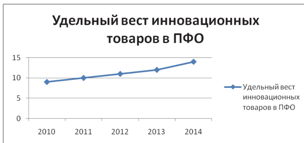
Рис. 3. Удельный вес инновационных товаров по ПФО [5]