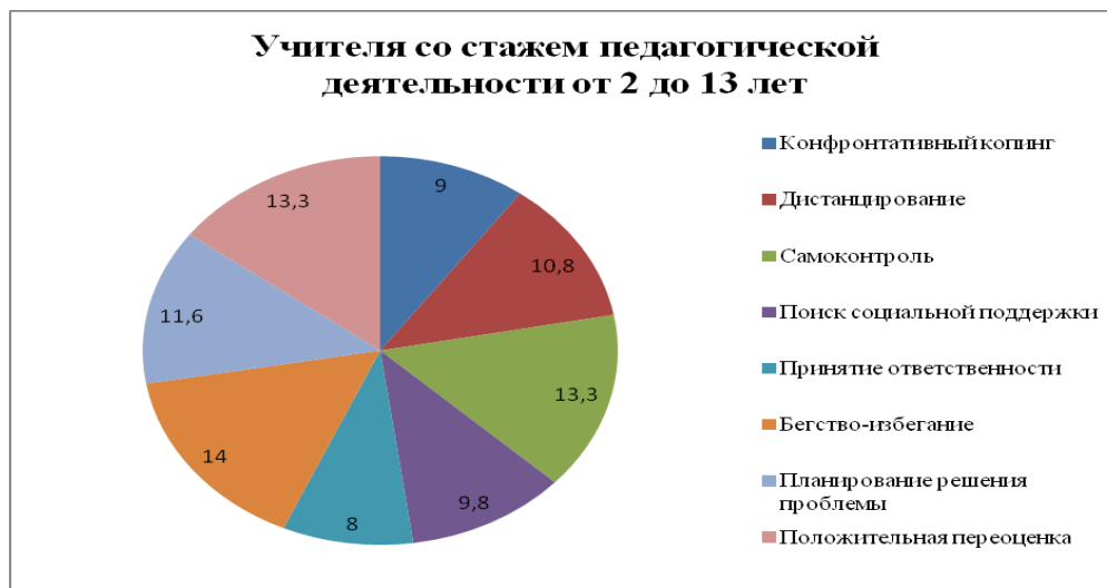
Рис.1. Гистограмма копинг стратегий молодых педагогов (со стажем педагогической деятельности от 2 до 13 лет)

(SACS) были выявлены стратегии молодых педагогов (Рисунок 1).