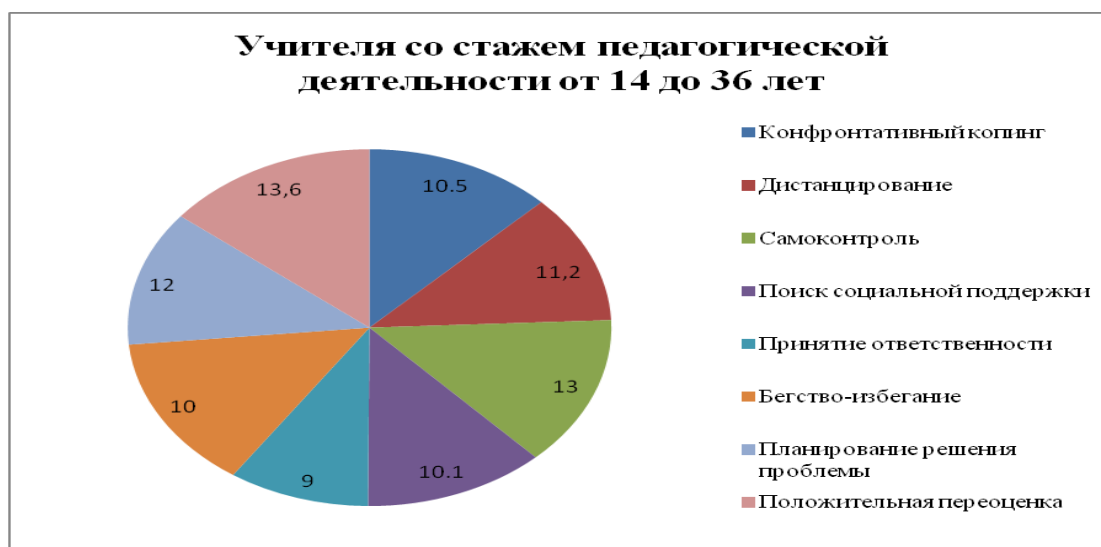
Рис.2. Гистограмма копинг стратегий опытных педагогов (со стажем

Стратегии поведения учителей (со стажем педагогической деятельности от 14 до 36 лет) в стрессовых ситуациях отражены на рисунке 2.