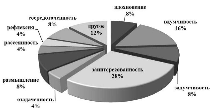
Рис. 2. Познавательные состояния в педагогической деятельности

Ведущим элементом структуры познавательных состояний, общим для научных сотрудников и педагогов, является фрустрация. Познавательные состояния понижают уровень фрустрации за счет повышения уровня регуляторных способностей и сопровождаются улучшением функциональных состояний.